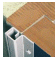
För utåtgående falsade dörrar/ fönster