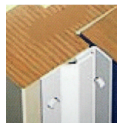
För inåtgående dörrar/fönster