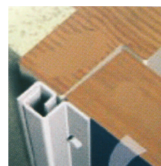
För utåtgående dörrar/fönster